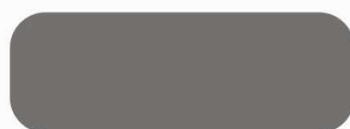
9007 hall alumiinium