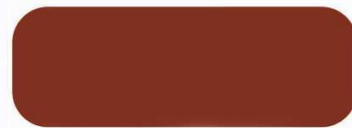
RR 750 kivipunane