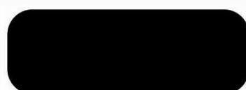
RR 33 must