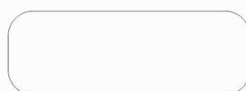
RAL 9010 valge