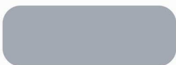
9006 valge alumiinium