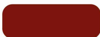
RR 29 punane